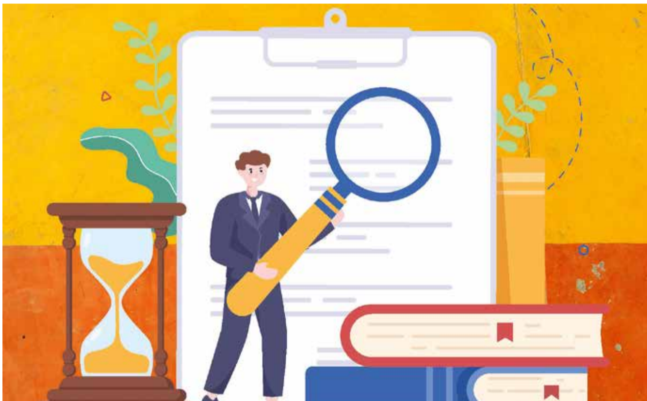
Illustration: @gambar-rini-astiyah bei Canva

Wenn wir über Zugangsbarrieren sprechen, fallen uns oft Dinge ein, die offensichtlich den Zugang behindern. Offensichtlich deshalb, weil man sie offen sieht. Der zu hohe Bahnsteig, der nicht alle Menschen gut ein- und aussteigen lässt. Der fehlende abgesenkte Bordstein, der fehlende Aufzug, die zu schmale Tür oder ein Radweg, der einfach mitten auf der Fahrbahn endet. Das alles lässt sich mit dem bloßen Auge feststellen. Doch wer sich mit Intersektionalität und Feminismus beschäftigt, weiß: nicht alle Barrieren sind sichtbar.