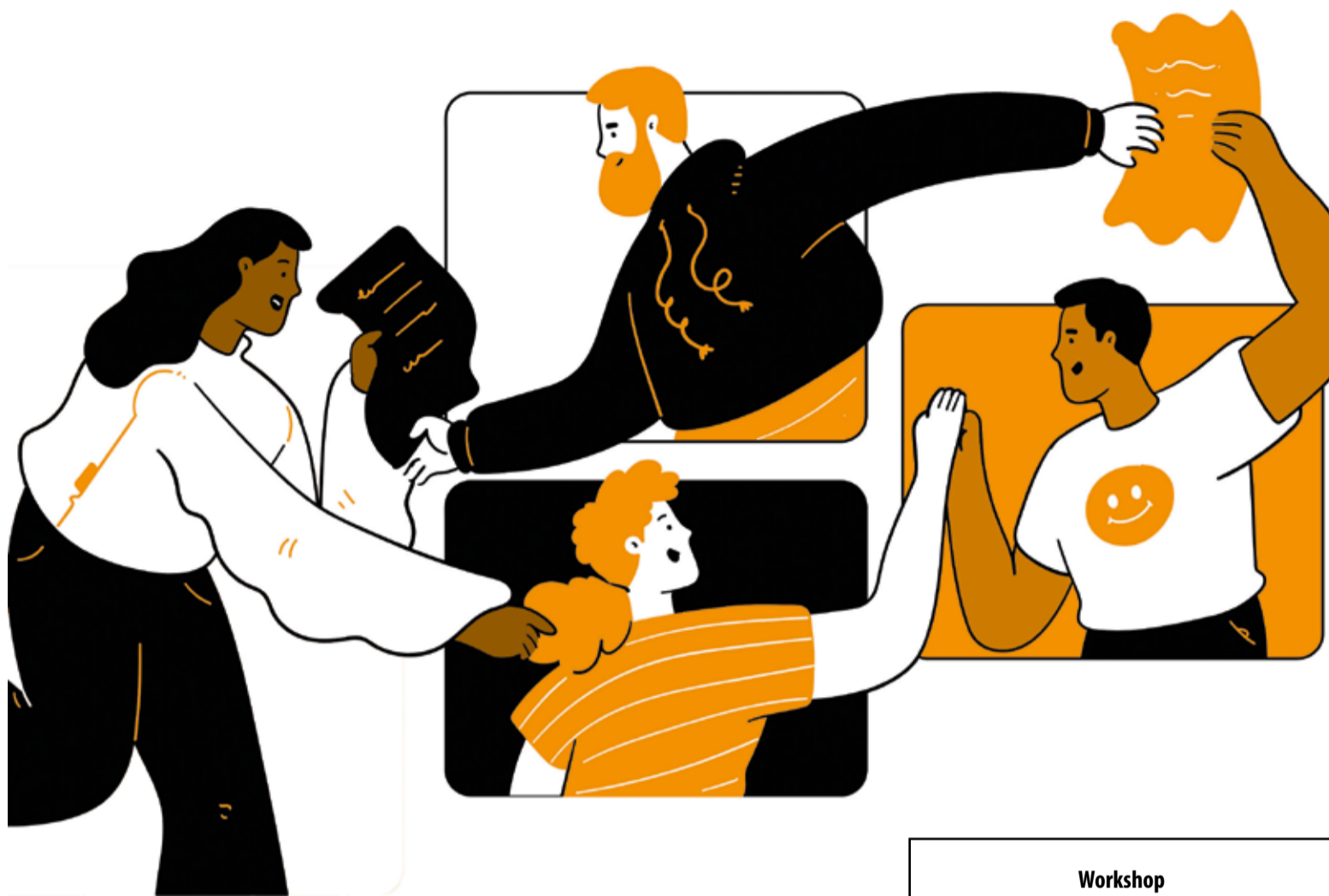
Illustration: @getillustrations bei Canva

Workshop "Hurra, Intersektionalität! --- und wie geht das?" am 18. und 19. November Stadtteilzentrum Ricklingen