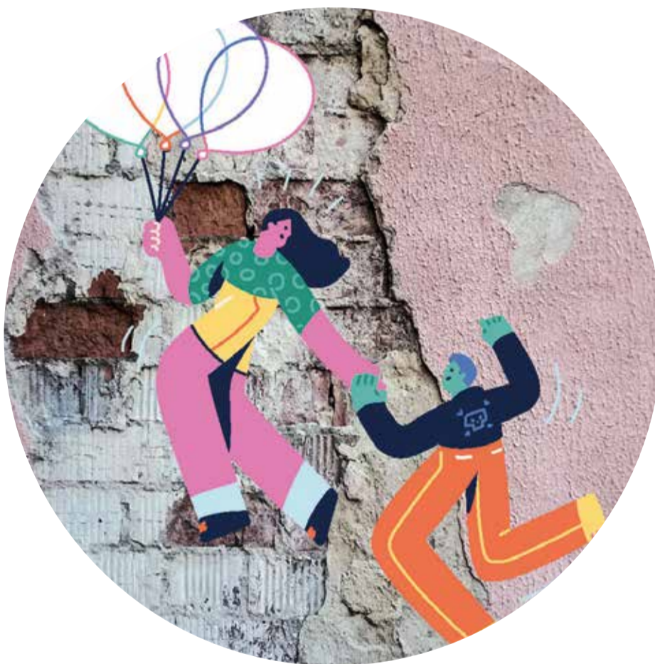
Illustration: @getillustrations bei Canva